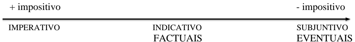
Figura 1 – Graus de força imperativa nas construções condicionais

direcionamento/imposição da orientação dada. Já o subjuntivo, pertencente ao modo irrealis , serve à indicação de incerteza e eventualidade, de que deriva o menor grau de direcionamento/imposição da orientação, o que podemos representar pelo seguinte esquema: